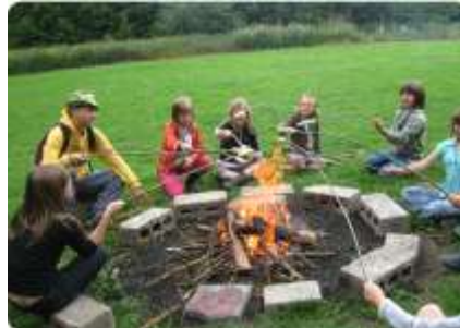
Sport & Aventure Sport & Abenteuer