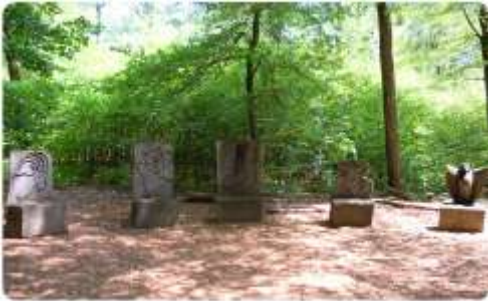
Sentier didactique à Heppenbach Leerpfad in Heppenbach

Über Landesgrenzen hinaus, haben Tourismusexperten aus Nordrhein-Westfalen, Rheinland-Pfalz und aus dem Naturpark Hohes Venn-Eifel in Belgien, im Rahmen des Regional-Programms der Europäischen Union (Interreg IV), ein vielfältiges Naturerlebnisprogramm entwickelt. Das Online-Portal www.eifel-natur-reisen.de steht zu ihrer Verfügung.