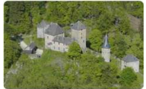
Château de Rheinhardstein Burg Rheinhardstein